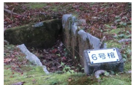
子どものものと思われる石棺

*博物館の外にも、舟形石棺やSLをはじめ、いろいろな展示物があります。ぜひごらんください。*